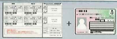
「接種券」(例) マイナンバーカード等