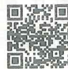
（※2）取組の5つのポイント