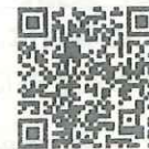
（※5）業種・業態別マニュアル