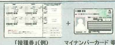
「接種券」(例) マイナンバーカード等