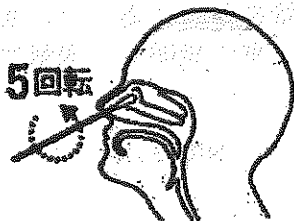
鼻腔ぬぐい液採取