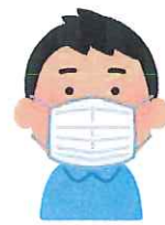
正しいマスク着用